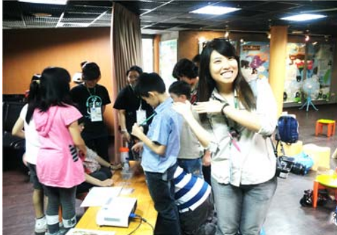
營員觀察獼猴的毛髮。