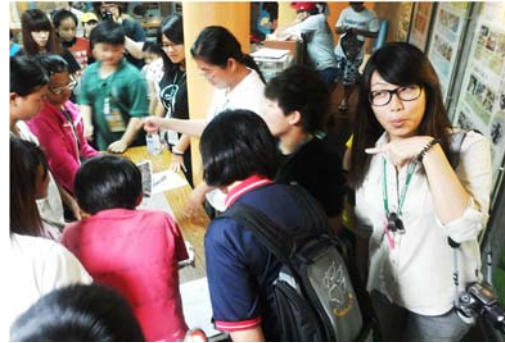
這裡則是觀察獼猴的糞便…