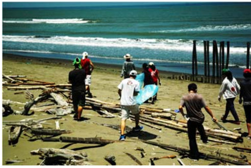
學員積極投入淨灘活動中。