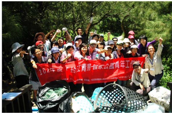
整理和統計淨灘後垃圾，大家來張大合照