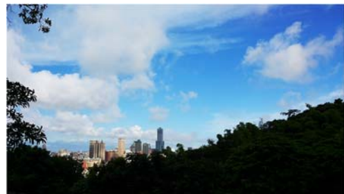
壽山擁有美麗的景色，這裡看的高雄市也一覽無遺！