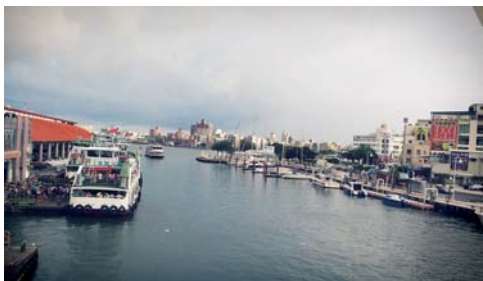
護送小朋友到這裡，他們上了渡輪後還呼叫我跟我揮手說拜拜~